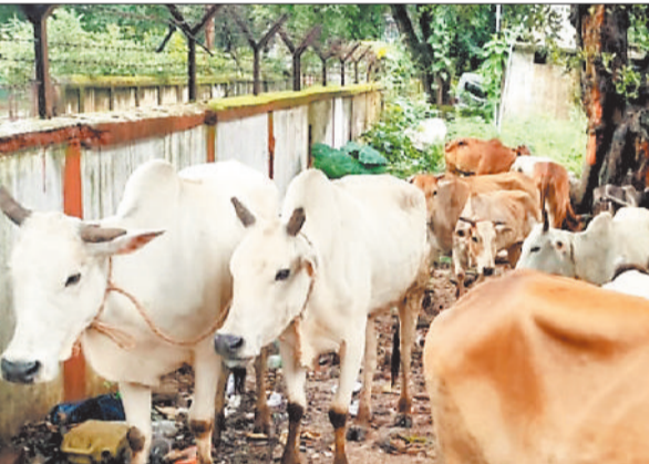
छापामार कार्रवाई में बरामद गौवंश।