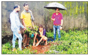
जशपुरनगर। अंतराष्ट्रीय सहकारिता दिवस वृक्षारोपण कार्यक्रम का हुआ आयोजन