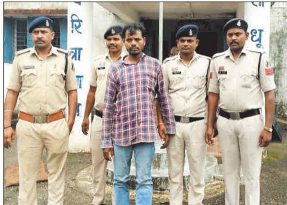
पुलिस गिरफ्त में गौ तस्करों का आरोपी।

पुलिस ने एक बार फिर गौ-तस्करों पर बड़ी कार्रवाई करते हुए 37 गौवंशों को तस्करों के चंगुल से छुड़ाया है। दो अलग-अलग मामलों में पुलिस ने एक तस्कर को गिरफ्तार किया है, जबकि अन्य आरोपी अंधेरे और जंगल का फायदा उठाकर भागने में सफल हो गया। पुलिस की इस कार्रवाई को ऑपरेशन शंखनाद के तहत अंजाम दिया गया, जो जिले में सक्रिय गौ-तस्करों के खिलाफ चलाया जा रहा। अब तक इस अभियान के अंतर्गत 1100 से अधिक गौवंश मुक्त कराए जा चुके हैं और 128 तस्करों को न्यायिक हिरासत में भेजा जा चुका है।