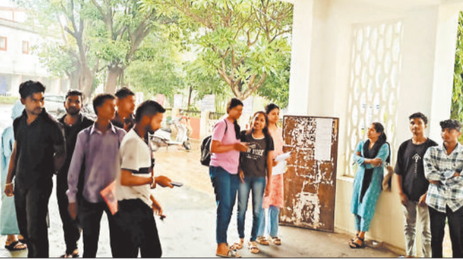
कॉलेज द्वारा जारी मेरिट सूची में अपना नाम खोजते विद्यार्थी।

राजीव गांधी पीजी कॉलेज में पिछले दो सालों से नई शिक्षा नीति के तहत निर्धारित पाठ्यक्रम का संचालन किया जा रहा है। पिछले साल कॉलेज ने एसजीजीयू के माध्यम से प्रवेश का पंजीयन कराया था जिससे कुछ बाधाओं का सामना करना पड़ा। इस बार कॉलेज ने स्वयं की वेबसाइट पर प्रवेश के लिए पंजीयन कराया था। पंजीयन की तिथि 30 जून तक निर्धारित थी। प्रथम चरण की प्रवेश प्रक्रिया में स्नातक कक्षा के 850 सीटों के लिए 1321 छात्र-छात्राओं ने पंजीयन कराया था। इसी तरह स्नातक विज्ञान अंतर्गत गणित संकाय की 275 सीटों के लिए मात्र 262 आवेदन, विज्ञान बायो संकाय की कुल 250 सीटों के लिए सर्वाधिक 1075 तथा स्नातक वाणिज्य संकाय की 440 सीटों के लिए 615 एवं बीसीए की 60 सीटों के लिए 179